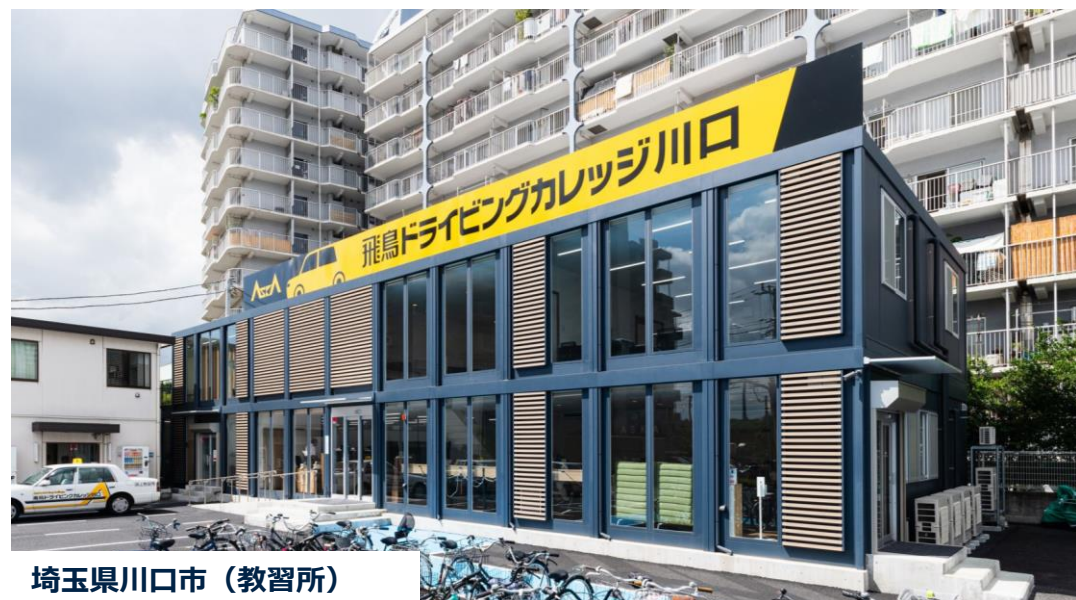
埼玉県川口市（教習所）