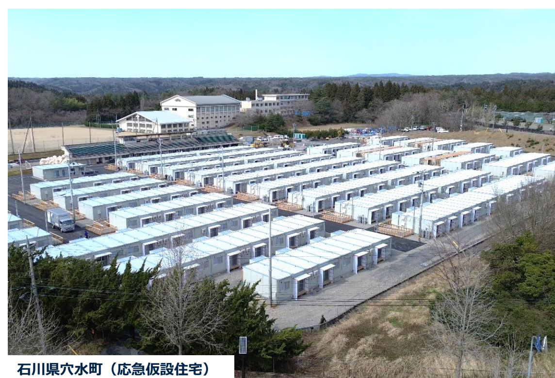
石川県穴水町（応急仮設住宅）