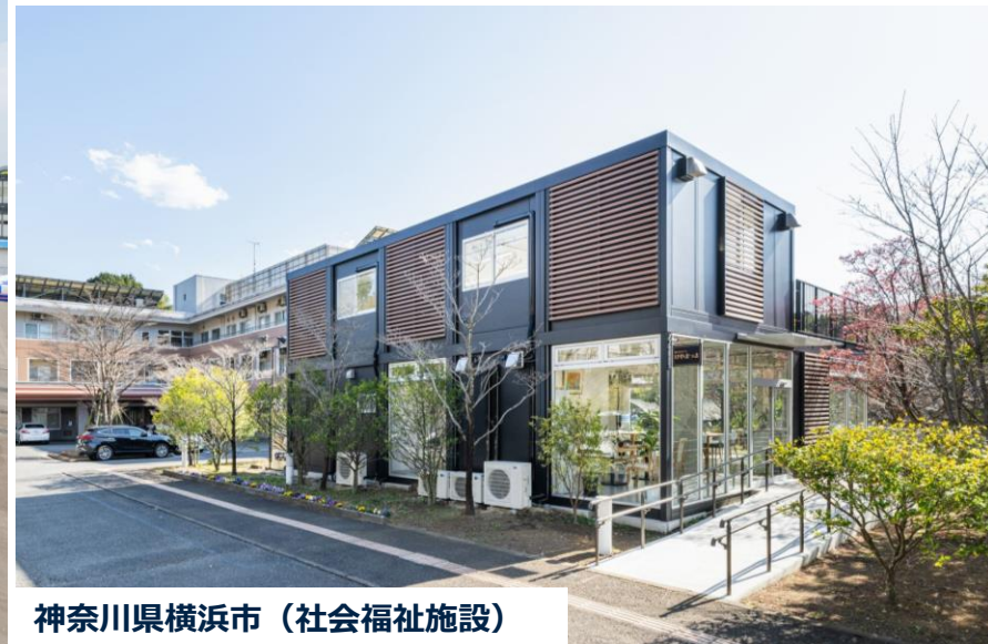
神奈川県横浜市（社会福祉施設）