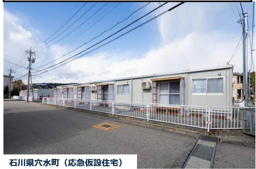
石川県穴水町（応急仮設住宅）