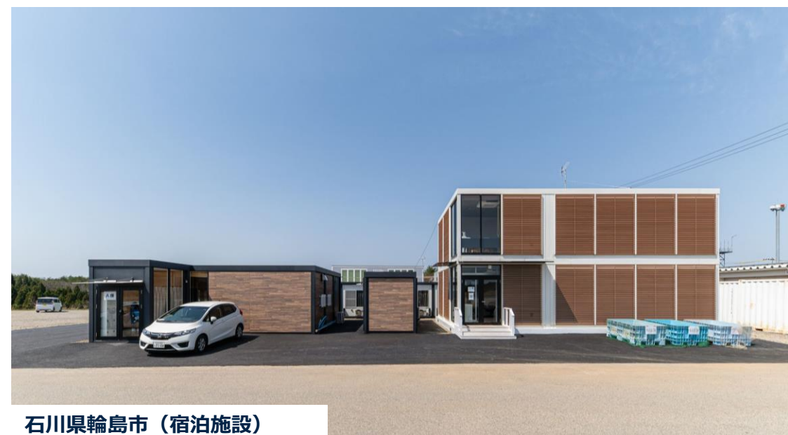
石川県輪島市（宿泊施設）