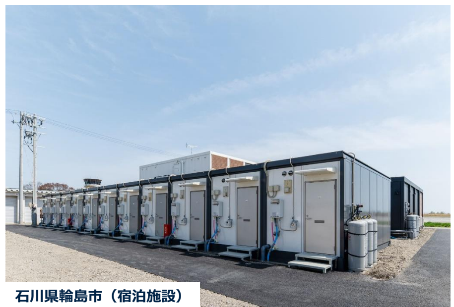
石川県輪島市（宿泊施設）