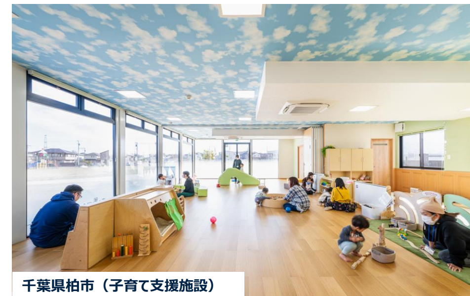
千葉県柏市（子育て支援施設）