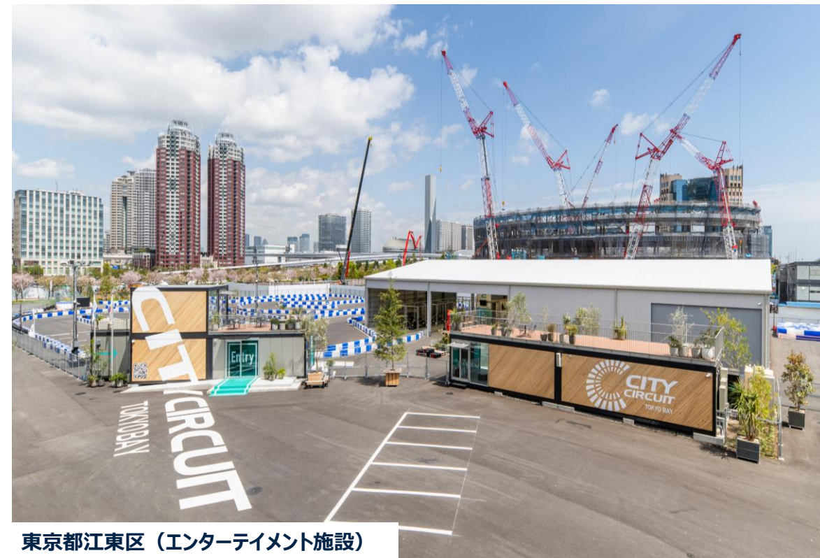
東京都江東区（エンターテイメント施設）