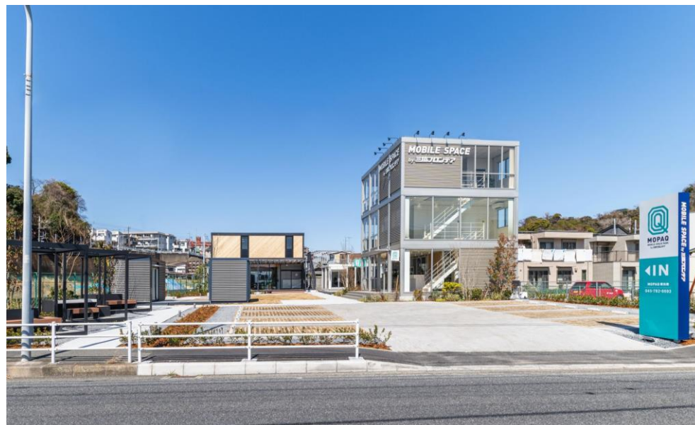
【MOPAQ春日部】 2023.11.10 リニューアル