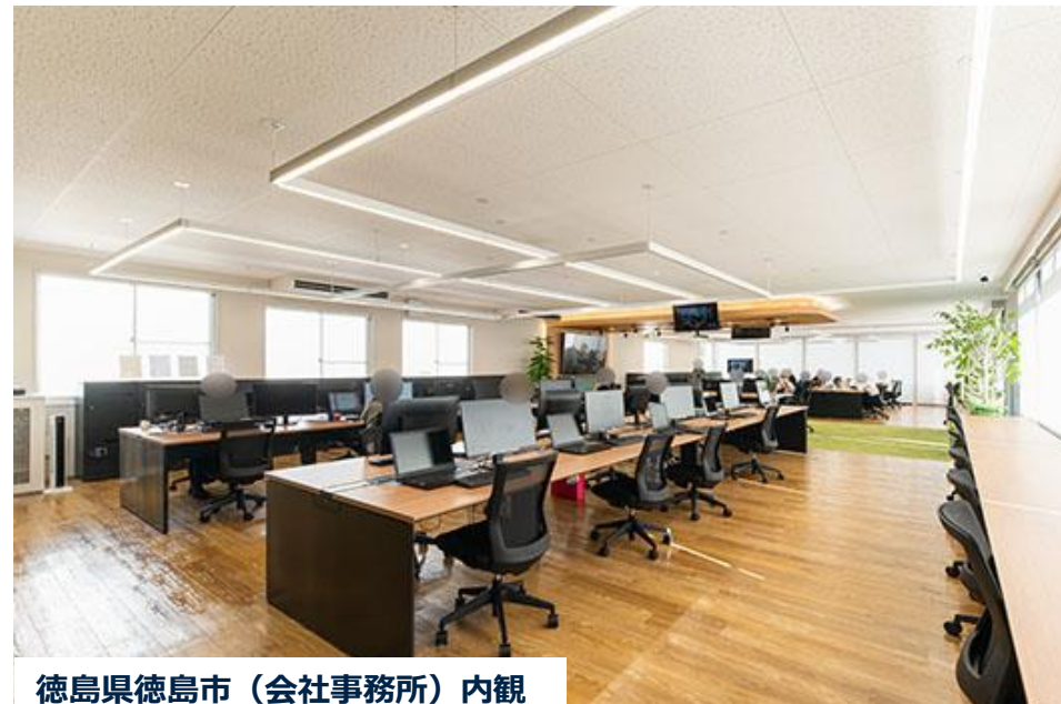
徳島県徳島市（会社事務所）内観