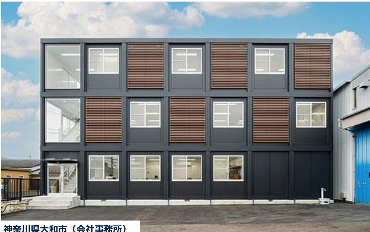
神奈川県大和市（会社事務所）