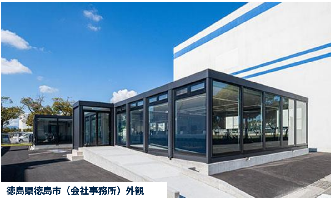
徳島県徳島市（会社事務所）外観