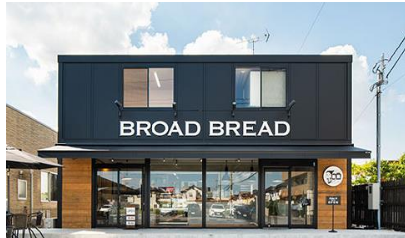
茨城県守谷市（飲食販売店）