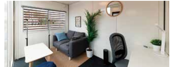
在宅ワークスペース 内観

ホームページのアクセス数やお問い合わせも年間を通じて多くいただいております。展示場にも大変多くのお客様にご来場いただいております。ご要望に沿ったモバイルスペースをご提供できるよう、引き続き取り組んでまいります。