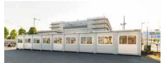
病院付属ワクチン接種施設 外観