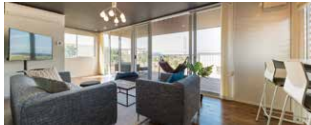
神戸総合展示場 内観