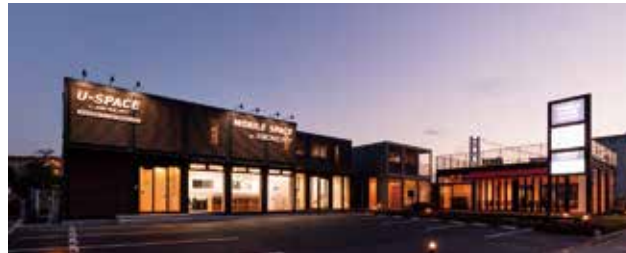
神戸総合展示場 外観