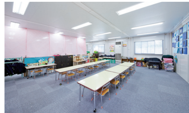
幼稚園仮設園舎(内観)