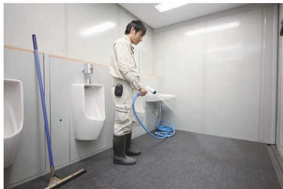
水はけ良好で排水できる床