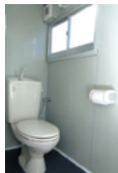
イベントや仮設会場などでは対応しにくかった従来のトイレカプセル

工場内でトイレを組み込むため、現場での工事・施工が少なく済みます。設置後も、ユニットハウスごと移設できるので、イベントなどで活躍しています。