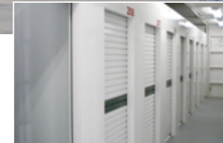
U-SPACE加古川北在家店(トランクルーム)