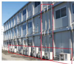
室外機を地上に設置していた従来のエアコン

従来は、地上に室外機を置くスペースが必要でしたが、エアコンパネルを使うとスペースをとり、見た目もすっきり。パネルを内側から外し、室内でエアコンの保守点検ができるため、メンテナンスも簡単でより安全です。