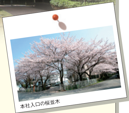
本社入口の桜並木