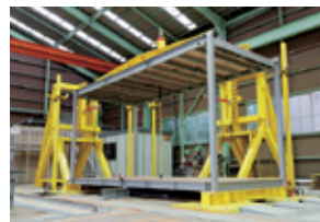
強度性能試験装置

当社では、オリジナルの性能試験装置を使って、ユニットハウスの性能を評価・検証しています。性能試験装置開発のきっかけは、自然災害が多発した2004年に遡ります。同年、本社内で、性能試験装置の開発プロジェクトが立ち上がり、翌年5月に2機の性能試験装置が稼働を開始。「強度性能試験装置」は、実物大のユニットハウスを使い、耐久性を検証。一方、「水密性能試験装置」では、暴風雨などを想定した実証試験を実施しています。これらの性能試験装置を使って、より安全な製品開発に取り組んでいます。