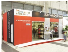
東京モーターショーで利用される ユニットハウス