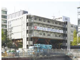
3階建の建設現場事務所 『COSMO CT-J』

また、施工時の安全性と効率性をさらに向上した新製品『COSMO CT-J』の販売活動の推進により、一層のシェア拡大に取り組んでいきます。