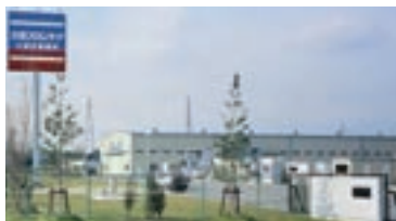
久留米工場(福岡県八女郡)

久留米工場(福岡県八女郡)は、平成8年に創設、面積は約30,000㎡(サービスセンター含む)、岩井工場(茨城県)や山崎工場(兵庫県)から搬送される部品の組み立を行う工場です。また、物流拠点となる久留米サービスセンターも併設しています。今後、本建築物件の受注活動を本格的に取り組んでいく上で、九州・中国地方の供給拠点として稼働するべく、より高度な生産技術の構築を目指していきます。