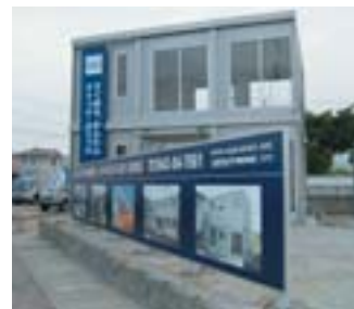
道路側に施工例看板を設置した展示場

今後とも積極的なPR活動に努めてまいります。ご支援どうぞよろしくお願いたします。