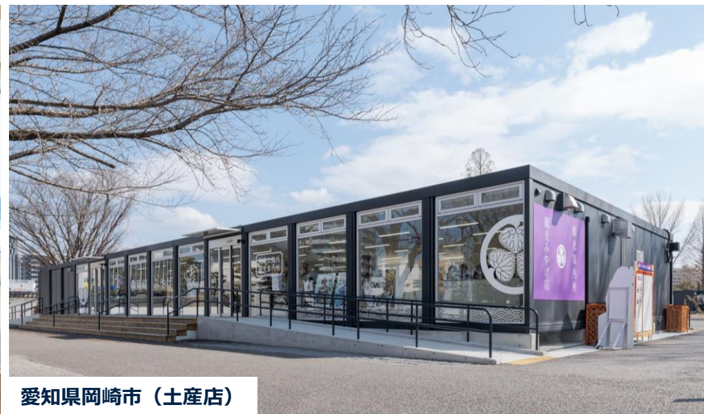
愛知県岡崎市（土産店）