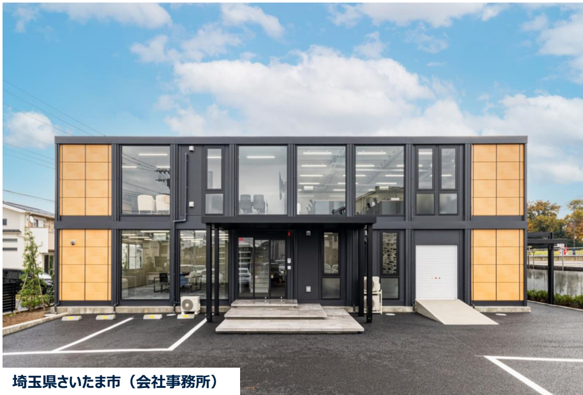
埼玉県さいたま市（会社事務所）