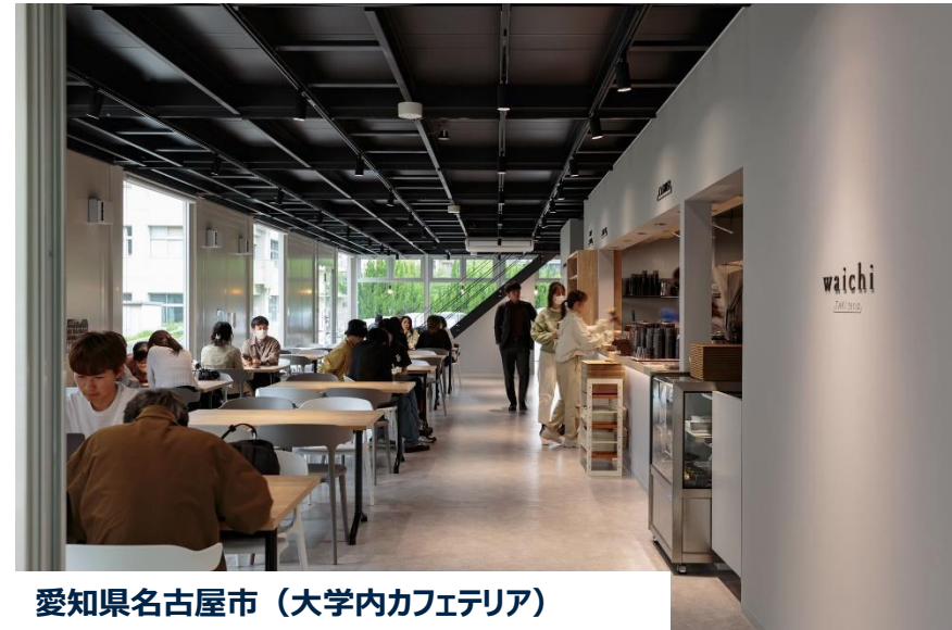
愛知県名古屋市（大学内カフェテリア）