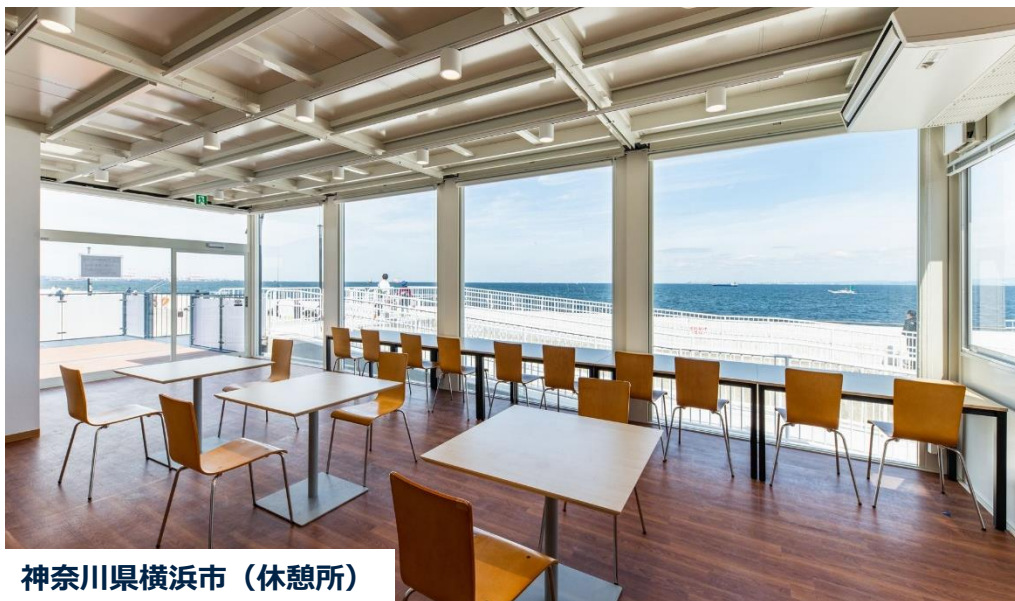
神奈川県横浜市（休憩所）